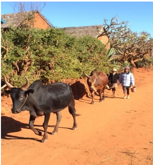
Le village d'Ankadibé.

14 jours : du 17 avril au 1 mai 2027 (voyages compris) / dates ajustables à 1 jour près.