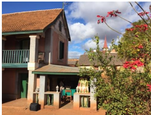
Lieu de vie, de repas à Ankadibé.

L'Association ANKADIBE intervient à Madagascar depuis 2005 auprès des populations rurales en situation de détresse et de misère afin de répondre à leurs besoins vitaux (accès à l'eau potable, éducation, santé dentaire, électrification)