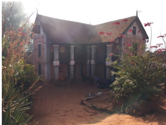
Maison d'accueil en dortoir dans le village d'Ankadibé

Compagnie NGC 25 Cie associée Cie associée au Champilambart à Vallet, À la Communauté de communes Sèvre et Loire et À BRAVOH!, service culturel de Clisson Sèvre et Maine Agglo.